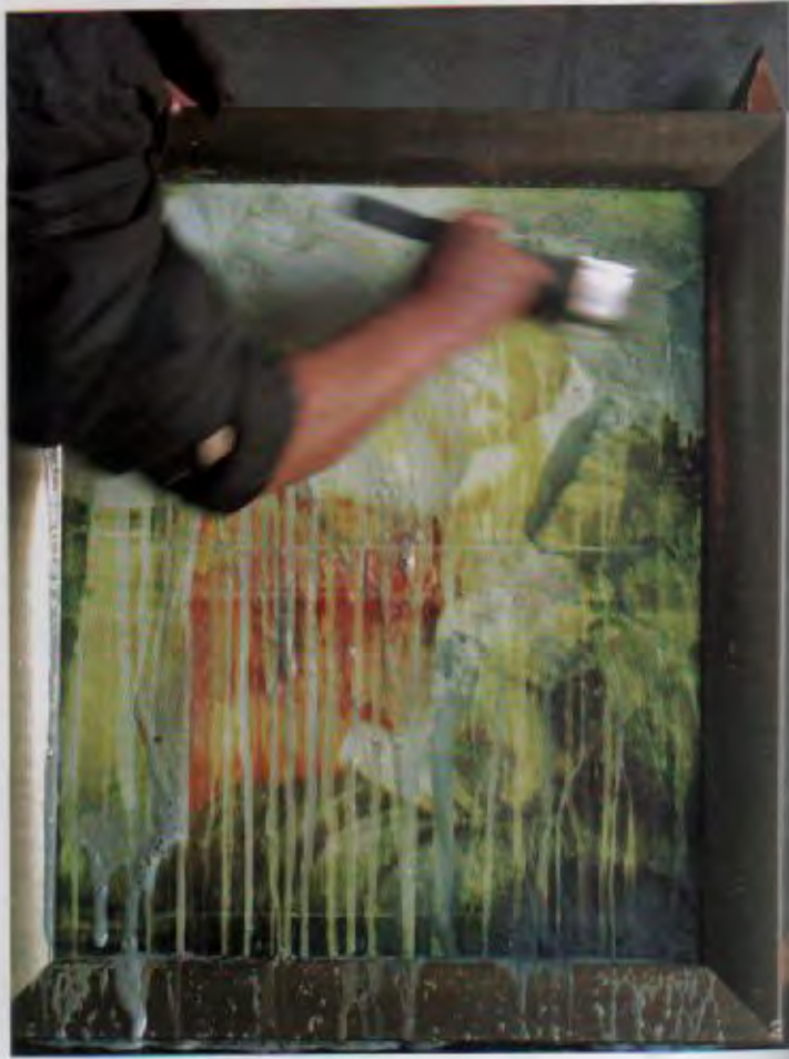
图1-2 白布·清洗成白布的时间是…… 北京大学首届实验短片展 中国青年影像艺术家实验电影（影像）作品展 2009年10月 北京 卓凡